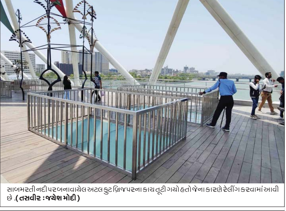
સાળમતી નદી પર બનાવવાયેલ અટલ કુટિલિયરના કાચ તૂટી ગયો હતો જેના કારણે રેલીંગ કરવામાં આવી છે.

(એનસી) ગાંધીનગર, ગુજરાત શિક્ષણ બોર્ડનું ધોરણ ૧૨ સાયન્સનું પરિણામ જાહેર થઈ ગયું છે. હવે સામાન્ય પ્રવાહના પરિણામની કામગીરી અંતિમ તબક્કામાં ચાલી રહી છે. ત્યારે આગામી ૨૫મેથી ૫મી જૂન વચ્ચે પરિણામ જાહેર થાય તેવી શક્યતાઓ છે. ધોરણ ૧૨ સામાન્ય પ્રવાહનું પરિણામ જાહેર થયા બાદ ધોરણ ૧૦નું પરિણામ ગણતરીના દિવસોમાં જ જાહેર થઈ જશે. હાલમાં શિક્ષણ બોર્ડ દ્વારા પરિણામની કામગીરી અંતિમ તબક્કામાં ચાલી રહી છે. વિદ્યાર્થીઓ પણ પરિણામની આતુરતા પૂર્વક રાહ જોઈને બેઠા છે. બીજી તરફ માર્ચ-૨૦૨૩માં લેવામાં આવી હતી ધોરણ-૧૦ અને ૧૨ની પરીક્ષામાં ગેરરીતિ રોકવા માટે બેઠક વ્યવસ્થા સીસીટીવી કેમેરાથી સફળ વર્ગબંધમાં કરવામાં આવી હતી. ત્યારે વિદ્યાર્થીઓએ પરીક્ષામાં ફેરવી ગેરરીતિમાં બોર્ડના ફલાઈંગ સ્ક્રોલમાં છટકી ગયેલા વિદ્યાર્થી હવે સીસીટીવી કેમેરાના ફૂટેજમાં ઝડપાઈ ગયા છે. જેના આધારે ધોરણ-૧૦ અને ૧૨ની પરીક્ષામાં ગેરરીતિ આચરનારા વિદ્યાર્થીઓ ઝડપાઈ ગયાં છે. ગેરરીતિ રોકવા માટે બનાવવામાં આવેલી અધિકારીની ફલાઈંગ સ્ક્રોલ માટે ૬૦ વિદ્યાર્થીને જ પકડી શકી છે. વર્ગબંધમાં ગોઠવાયેલા સીસીટીવી કેમેરાની ચકાસણી બાદ બોર્ડ ગેરરીતિના કેસ અલગ તારવ્યા છે. જેના આધારે જે તે વિદ્યાર્થીને પરિણામો અનામત રાખવામાં આવશે. હવે પછી ગેરરીતિ આચરતા પકડાયેલા વિદ્યાર્થીને નોટિસ આપીને બોર્ડના અધિકારીઓ સમક્ષ બોલાવશે અને તેમનો ખુલાસો મેળવવા બાદ તેમના જવાબના આધારે ગેરરીતિના કેસ માટે નિયત કરેલા નિયમોનુસાર શિક્ષણ બોર્ડ દ્વારા શિક્ષા કરવામાં આવશે.