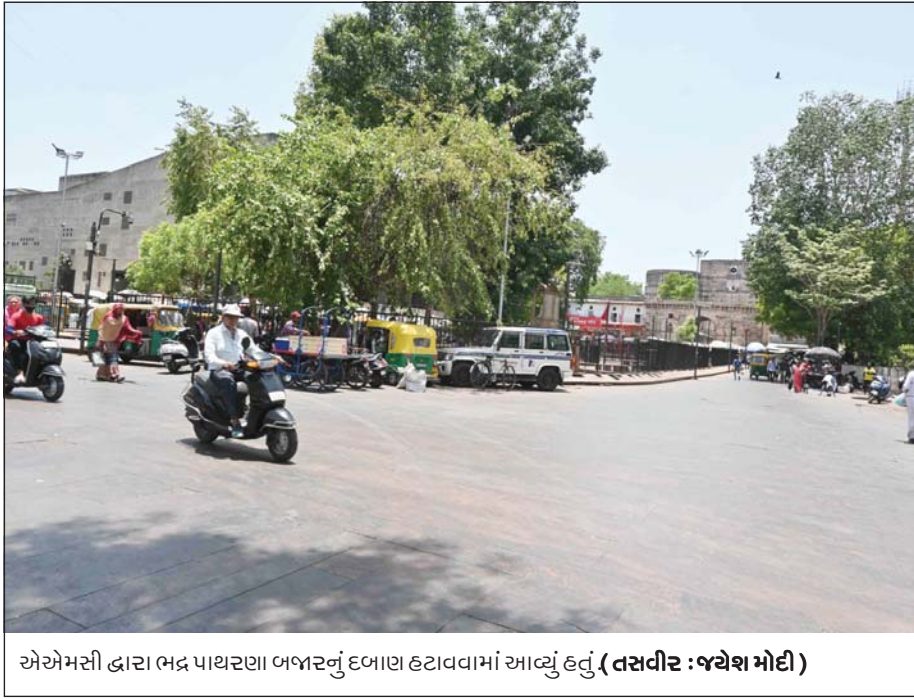
એએમસી દ્વારા ભદ્ર પાથરણા બજારનું દળાહાટાવવામાં આવ્યું હતું.

આ નવા નિયમ બાદ હવે ચારેય કેટ્ગરીની પરીક્ષા સંયુક્ત રીતે લેવામાં આવશે. હવેથી ઉમેદવાર ગુજરાતી કે અંગ્રેજી ભાષામાં પરીક્ષા આપી શકશે. આ ઉપરાંત દર વર્ષે વિભાગોએ પોતાની ખાલી જગ્યાઓ અંગે સેક્રેટરી ને જાણ કરવાની રહેશે. ભરતી બોર્ડના નિયમોને આધિન પરીક્ષાનું આયોજન કરવામાં આવશે. આ પહેલાં વર્ગ-૩ની ભરતી માટે માત્ર એક જ પરીક્ષા લેવામાં આવતી અને પરીક્ષાનું પરીણામ જાહેર થતા જ સીધી ભરતી કરીને ઓર્ડર આપી દેવામાં આવતા હતાં. જોકે સુતોમાંથી મળતી માહિતી મુજબ સરકારી નોકરીની ભરતીઓ માટેની પરીક્ષાઓમાં વારંવાર થતાં પેપરલીક કાંડ અને ગેરરીતિઓને અટકાવવા સરકારે આ નિર્ણય કર્યો છે.