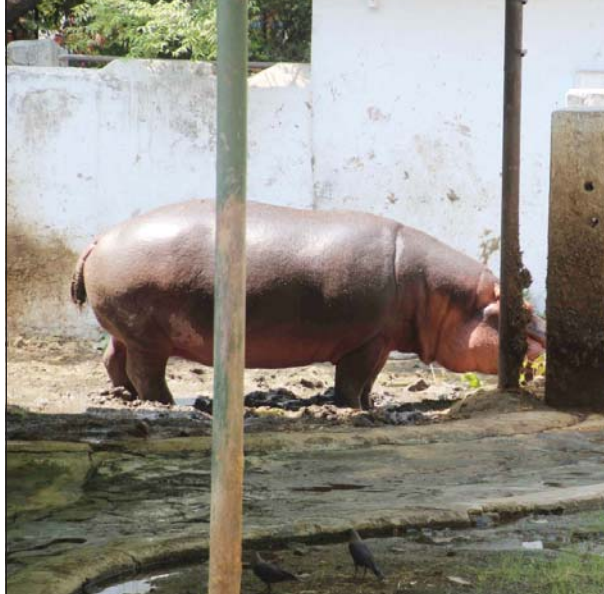
ગરમીના કારણે કાંકરીયા ઝૂમમાં હિપ્પોપોટેમસના હોજન પાછી બદલવામાં આવ્યું હતું. જેના કારણે હિપ્પોપોટેમસને બહાર કાઢવામાં આવ્યા હતા.

ગુજરાતમાં કોરોના કેસોમાં સતત ઘટાડો થઈ રહ્યો છે. જેમાં ૧૯ મેના રોજ કોરોનાના નવા ૧૧ કેસ નોંધાયા છે. જ્યારે કોરોનાના એક્ટિવ કેસની સંખ્યા ઘટીને ૨૦૦ની અંદર આવી છે. એક્ટિવ કેસની સંખ્યા ૧૧૬એ પહોંચી છે. જેમાં અમદાવાદમાં ૦૭, બનાસકાંઠામાં ૦૧, મહેસાણામાં ૦૧, વડોદરામાં ૦૧, વલસાડમાં ૦૧ કેસ નોંધાયાં છે. જ્યારે કોરોના રિકવરી રેટ ૯૯.૧૩ ટકા થયો છે. તેમજ કોરોનાથી આજે ૧૯ દર્દી સાજા થયા છે. આ દરમિયાન છેલ્લા ત્રણ વર્ષથી કોરોના સમગ્ર વિશ્વમાં હાહાકાર મચાવી રહ્યો છે. આ ખતરનાક ચેપને કારણે કરોડો લોકોના મોત પણ થયા છે. કોવિડ ૧૯ ના વિવિધ પ્રકારોને કારણે, આ ચેપ ખૂબ જ ખતરનાક બની ગયો હતો. વિશ્વ આરોગ્ય સંસ્થાએ વૈશ્વિક ખતરો અને રોગચાળો જાહેર કર્યો હતો. હવે આ રોગચાળાને લઈને એક રાહતના સમાચાર છે.