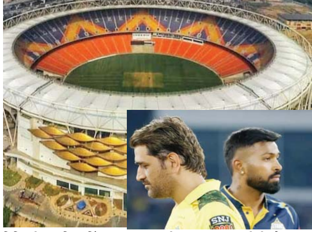
ટિકિટની પ્રારંભિક કિંમત ૧૦૦૦ રૂપિયા હતી. જ્યારે ઉપલા સ્તરના સ્ટેન્ડની ટિકિટની કિંમત રૂ. ૨૫૦૦ થી રૂ. ૬૦૦૦ સુધીની છે, ત્યારે આઈપીએલની ફાઇનલ મેચ જોવા માટે દર્શકોમાં ભારે ઉત્સાહ જોવા મળી રહ્યો છે. આઈપીએલની ફાઇનલ મેચ ૨૮ મેના રોજ નરેન્દ્ર મોદી સ્ટેડિયમમાં રમાશે. આ પહેલાં ૨૬ મેના રોજ ચોખ્ખાની ક્વોલિફાયરમાં ફાઇનલમાં રમનારી બીજી ટીમ નક્કી કરવામાં આવશે.

અમદાવાદ, આઈપીએલ ૨૦૨૩ હવે ફાઇનલ તરફ આગળ વધી રહી છે. ફાઇનલ પહેલાં શુક્રવારે મુંબઈ ઈન્ડિયન્સ અને ગુજરાત ટાઇટન્સ વચ્ચે ક્વોલિફાયર-૨ મેચ ઠીક ઠીક આ મેચની ટિકિટો વેચાઈ ગઈ હતી. દર્શકો ફાઇનલ મેચની ટિકિટ માટે લડી રહ્યા છે. આ માટે સ્ટેડિયમ બહાર પ્રથમ દિવસે ભારે ભીડ એકઠી થઈ હતી. આઈપીએલની ૧૬મા સંસ્કરણની ફાઇનલ મેચ ૨૮ મેના રોજ નરેન્દ્ર મોદી સ્ટેડિયમમાં રમાશે. આ પહેલાં ૨૬ મેના રોજ ચોખ્ખાની ક્વોલિફાયરમાં ફાઇનલમાં રમનારી બીજી ટીમ નક્કી કરવામાં આવશે. આ મેચ પણ નરેન્દ્ર મોદી સ્ટેડિયમમાં રમાશે. નરેન્દ્ર મોદી સ્ટેડિયમમાં બંને મોટી મેચોની તૈયારીઓ ચાલી રહી છે ત્યારે ફાઇનલની ટિકિટ માટે ધમાલ ચાલી રહી છે.