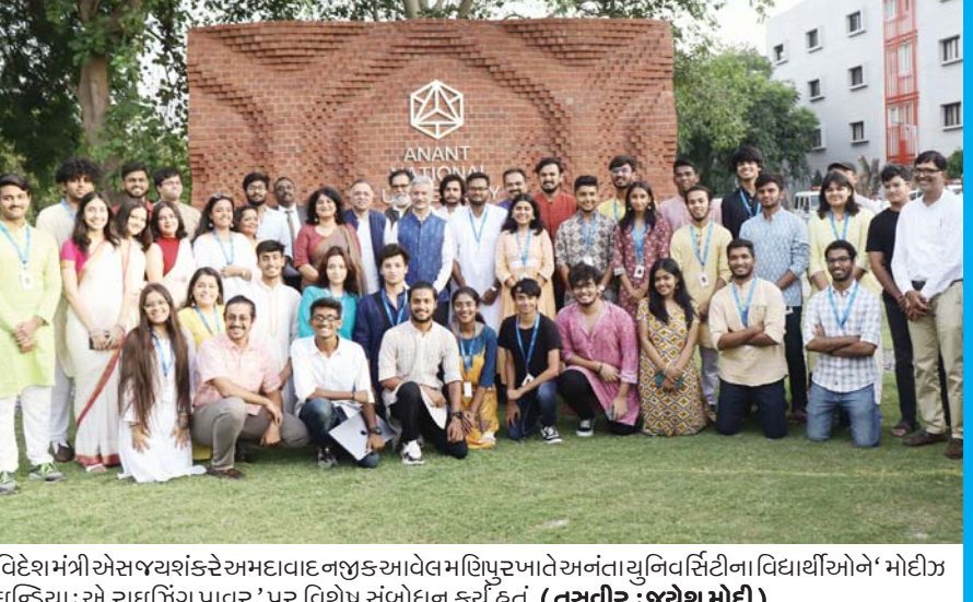
વિદેશ મંત્રી એસ જયશંકરે અમદાવાદના અણ્ડા એલેક્સાન્ડ્રા પાલેટ અંગતતા યુનિવર્સિટીના વિદ્યાર્થીઓને 'મોદીઝ ઇન્ડિયા : એ રાઇટિંગ પાવર' પર વિશેષ સંબોધન કર્યું હતું.

(એજન્સી) અમદાવાદ, રાજ્યભરના આદિવાસીનો મહારેલી યોજાઈ હતી. અમદાવાદના સાબરમતી રિવરફ્રન્ટ પર આદિવાસી સમાજની ડિવિલોપમેન્ટ મહારેલી યોજાઈ હતી. આદિવાસી સમાજના કેટલાક લોકો ધર્મપરિવર્તન કર્યા બાદ પણ સમાજને મળતા લાભ મેળવે છે, જેના મૂળ આદિવાસી લોકોને લાભ મેળવવામાં મુશ્કેલી થાય છે એટલે આજે તેના વિરોધમાં મહારેલી યોજાઈ હતી, જેમાં હજારોની સંખ્યામાં લોકો જોડાયા હતા. આ રેલીમાં લોકોએ ડીજેના તાલે ડાન્સ પણ કરી રહ્યા હતા. 'આપણા ગામમાં વિધર્મી આવ્યા' ગીત પર આદિવાસીઓ ડાન્સ કરતા જોવા મળ્યા હતા. અમદાવાદમાં આજે રાજ્યભરના આદિવાસીઓ એકઠા થયા હતા. રીવરફ્રન્ટમાં અલગ-અલગ ૭ જગ્યાએથી રેલી યોજાઈ હતી. જ્યાં મુખ્યમંત્રી ભોલાયા હતા. સવાનો ભાવ ૨૪૦૦ થી ૨૯૫૦ રૂપિયા નોંધાયો હતો. તેમજ ઘઉંનો પ્રતિ મણનો ભાવ ૪૧૬ થી ૬૦૭ રૂપિયા નોંધાયો હતો. રેલીમાં લોકો ચાલતા-ચાલતા જોડાયા હતા. અલગ-અલગ રેલી નીકળીને આશ્રમ રોડ વલ્લભ સહનની પાછળના રિવરફ્રન્ટ ખાતે પહોંચી હતી. અનેક આદિવાસીઓ પોતાના પરંપરાગત પોશાકમાં પણ જોવા મળ્યા હતા. આદિવાસી સમાજને અનેક જગ્યાએ સરકારમાં લાભ મળે છે. આ લાભ મળવાને કારણે સારી નોકરી પણ મળે છે પરંતુ, સમાજના કેટલાક લોકો ધર્મ પરિવર્તન કરીને અન્ય ધર્મ અપનાવે છે. અન્ય ધર્મ લાલચમાં અપનાવે છે પરંતુ, આદિવાસી ધર્મ સાથેનો છેડો કાળતા નથી. અન્ય ધર્મમાં જોડાવા છતાં ધર્મ પરિવર્તન કરનાર વ્યક્તિ આદિવાસી સમાજને મળતો લાભ તો મેળવે જ છે, જેના કારણે મૂળ આદિવાસી સમાજને નુકસાન થાય છે જેથી આજે રેલી યોજાવામાં આવી હતી. સમાજના લોકો સાથે થતો અન્યાય રોકવા માટે આ રેલીમાં સમાજના લોકોએ ધર્માન્તરણ કર્યા બાદ સમાજને મળતા લાભ મેળવી રહ્યા છે. આ પ્રશ્ન વર્ષોથી ચાલતો પ્રશ્ન છે ત્યારે આજે રાજ્યભરમાંથી આદિવાસી સમાજના એકઠા થયા છે.