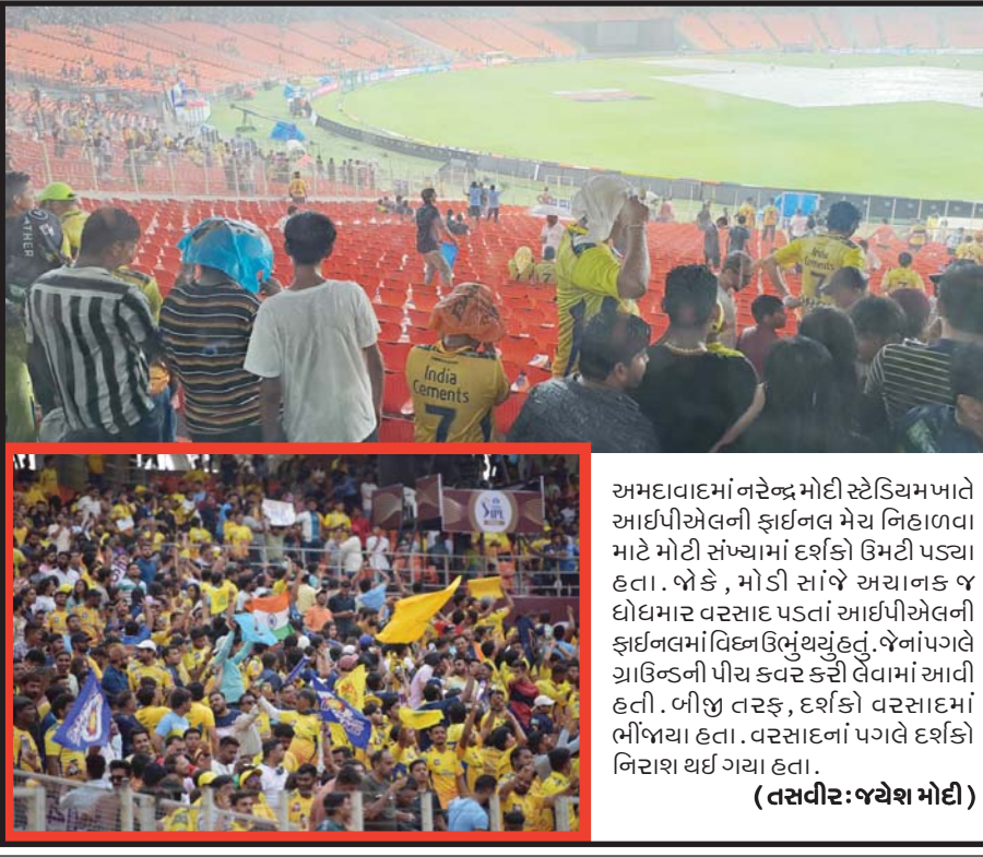
અમદાવાદમાં નરેન્દ્ર મોદી સ્ટેડિયમ ખાતે આઈપીએલની ફાઈનલ મેચ નિહાળવા માટે મોટી સંખ્યામાં દર્શકો ઉમટી પડ્યા હતા. બેંક, મોડી સાંજે અચાનક જ ઘોંઘમાર વરસાદ પડતાં આઈપીએલની ફાઈનલમાં વિદ્વન ઉભું થયું હતું. જેના પગલે ગ્રાઉન્ડની પીચ કવર કરી લેવામાં આવી હતી. બીજી તરફ, દર્શકો વરસાદમાં ભીંજાયા હતા. વરસાદના પગલે દર્શકો નિરાશ થઈ ગયા હતા.